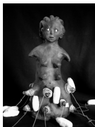
Operária – 38 x 18 x 13 cm – 2005 terracota, linha de poliéster algodão e papel japonês.

Atualizando mitos, Rosana representa em sua escultura a “condenação” das mulheres afro-descendentes a serem supermulheres, cujos corpos tornados máquina pela expropriação capitalista e re-naturalizado como mutação da natureza, seus olhos vítreos e azuis buscam assustados uma esperança fruto das mutações propiciadas pelos casulos, que não são de seda, brandura e luxo, mas de algodão e poliéster, simplicidade e modernidade. Esta é a história que Rosana Paulino conta, uma história mítica, repleta de uma simbologia de transformação, na qual a mulher é princípio e finalidade.