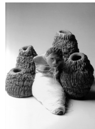
Número 1 com casulos, 2003, terracota, algodão, linha de poliéster e pigmento vermelho Número 1 – 13 x 13,5 x 7 cm • casulos – dimensões variáveis